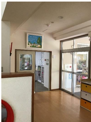
職員室(正面玄関から進んだ先)