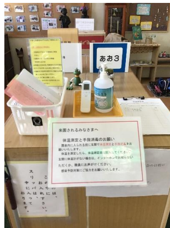
玄関内の青3組靴箱の上 にご用意しています