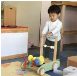
手作りマラカスをカタカタ車につけてみたよ。 カタカタ+シャカシャカ鳴っておもしろ〜い☺